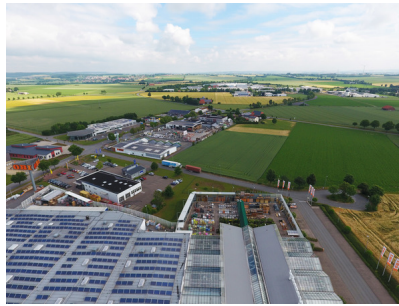
Industriestraße von der B7.jpg