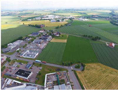
Gewerbefläche Heidfeld 5.000qm.jpg