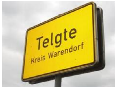
Telgte im Kreis Warendorf.JPG