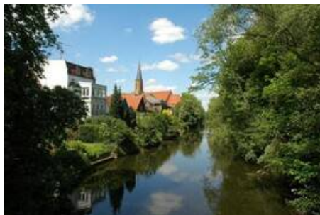
Lebenswerte Stadt - Emsblick.JPG