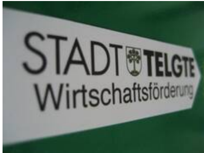
Wir freuen uns über Ihren Anruf 02504 13298.JPG