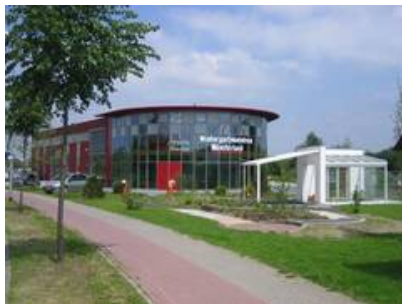
Einfahrtsituation Gewerbeparks Kiebitzpohl.JPG