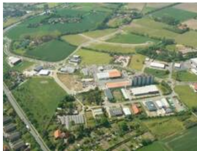
Luftbild Gewerbeparks Kiebitzpohl.JPG