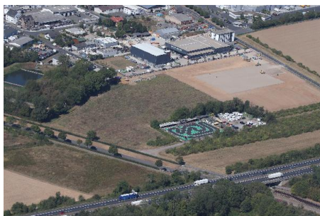
Gewerbegrundstück Bergiusstraße - Vogelperspektive mit Autobahn A 57