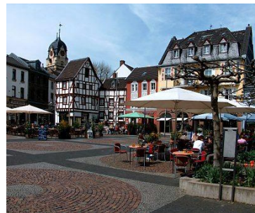
Alter Markt, Euskirchen