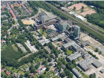
Schrägluftbild BW Westerholt Herten.jpg