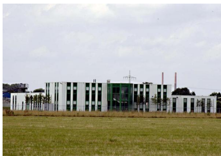
Gewerbe- und Industriegebiet Dremmen