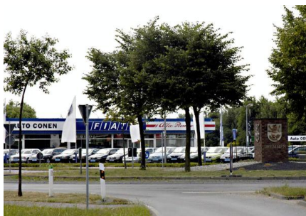
Gewerbe- und Industriegebiet Dremmen