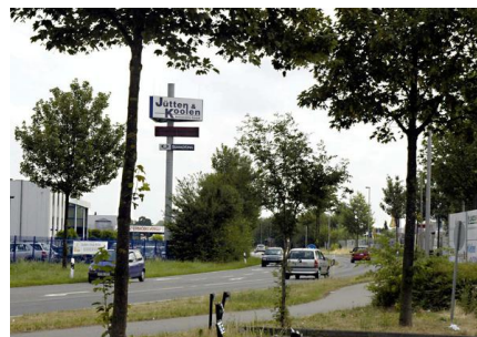
Gewerbe- und Industriegebiet Dremmen